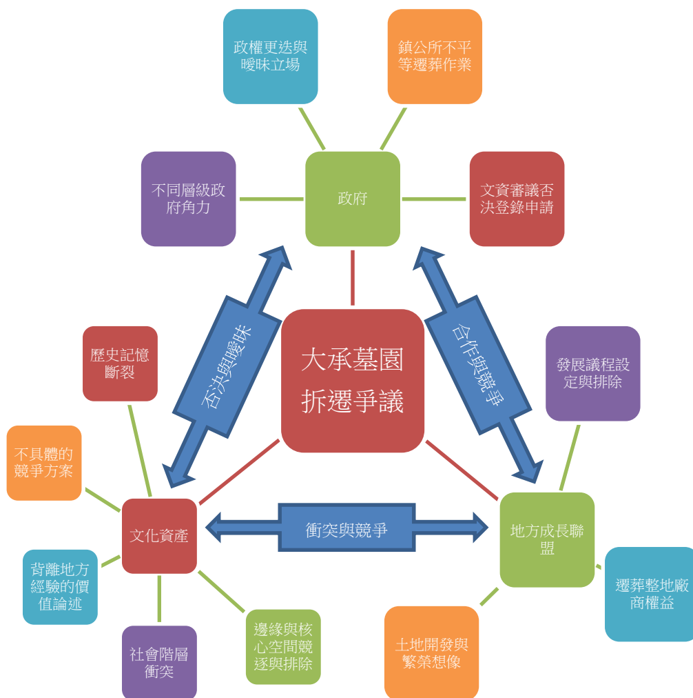
圖 1 大承墓園保存爭議圖