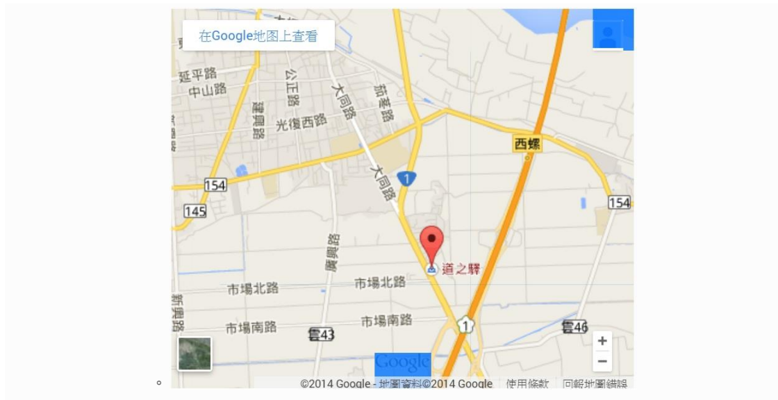
圖 2 大承墓園位置圖(今日「道之驛雲林形象物產館」地點即為小茄苳公墓)