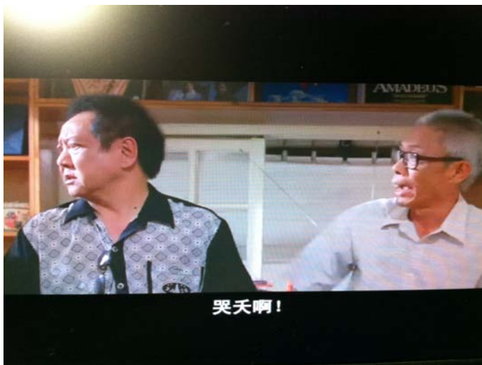
圖五：哭天啊！ 截自：海角七號

圖五是長輩教訓晚輩的情境，晚輩(郵差)因為懶惰沒去送信，因此長輩教訓晚輩勤勉盡職，以免誤了別人的大事。沒想到晚輩卻隨口回應現在通知都是打電話沒有人送信了，長輩一聽勃然大怒，怒斥道：「靠天啊，你以為你是郵局還是電信局啊！」。若此情境運用陳克對髒話的解釋，應是一種為了貶低他人的情感宣洩。髒話可以是為了突顯自己的優越感，藉由汗辱他人的過程來達到主宰權力的滿足（陳克，1995）。圖五中長輩藉由一句髒話不但反駁了晚輩的言論，也樹立了自己身為長輩不可侵犯性。