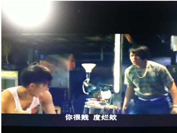
圖七：你很賤，度爛欸。

圖七的情境是一群朋友們彼此喝酒聊天，但某甲(右一)不勝酒力睡著了，結果被某乙(左一)潑了一臉酒，某甲醒來問某乙拿什麼潑他，結果某乙居然說當然是尿啊，氣得某甲起身罵：「你很賤 吔，度爛欸。」，之後便展開追逐。在此情境中，雖然雙方是有產生爭執的，但由於情境是和諧且歡愉的，且之後也沒有發展出爭端，朋友間也笑的很開心。若運用澳洲學者 Wajnryb 對髒話的分類，此情境可屬惡言咒罵，抑可是社交咒罵。此情境的出現的人都是生死與共的好朋友，甚至曾經結拜為兄弟，因此當他們互相對對方咒罵時，不僅是測試友情的堅定，也是證明彼此間是不可取代的。