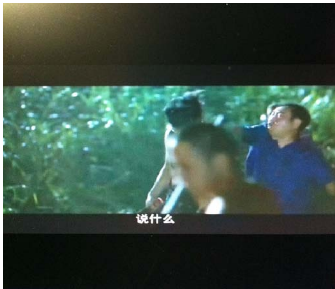
圖三：說什麼(說三小)。截自：艋舺

圖三的情境為一群年輕人參加集訓，每天都要耍棍耍槍做為訓練。其中一位受不了每天這樣的生活，便抱怨現在刀槍早已被手槍子彈取代，耍棍耍槍已經過時不能保護自己。然而這番言論正好被長輩聽到，於是怒斥晚輩不懂事亂說話。此情境的髒話帶有怒氣，而且有責備人的意味，跟據澳洲學者 Wajnyrb 對髒話的分類，較屬於惡言咒罵。惡言咒罵非常好理解，在衝突發生的時候所講出來的髒話幾乎都屬於此類。然而此種咒罵較值得注意的是雙方的權力關係，在圖三的情境中，教訓人的是那群年輕人的大哥，說起髒話罵起人來，格外理所當然，小弟也只能頻頻道歉。因此推論出握有權力的一方，說話的口氣會比較大，髒話冒犯的程度也較大。