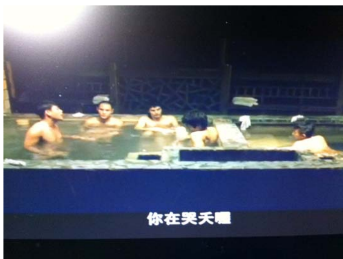
圖六：你在哭天囉。

圖六的情境是一群朋友洗澡時聊天的對話。其中一個人突然感嘆外地來欲刮分地盤的幫派管理的很好，個個人高馬大，做事井然有序。另一位就說不然你去加入他們好啦。原本那位聽了當然不爽，馬上回：「你在靠天喔，他們看起來真的比較威風啊。」之後便繼續嘻鬧。此情境中的髒話的確具有攻擊性，而對象是朋友無聊的吐槽，朋友叫他加入外來的幫派，這就代表他必需背叛他的朋友以及自己的幫派，這是不可能的事，因此也用髒話來隨便回應。語言學家 Burrige 指出：「一群朋友越是處於放鬆的環境，就會有越多髒話出現。」圖六的好朋友當時一起泡澡聊天，因此氣氛是很輕鬆的，在不到一分鐘的電影中，髒話在這場景中出現了五句，也回應了 Burrige 的說法。澳洲學者 Wajnryb 也指出在這種場合中出現的髒話，是為了表達談吐間的幽默，並無明顯的貶意，旨在加強彼此