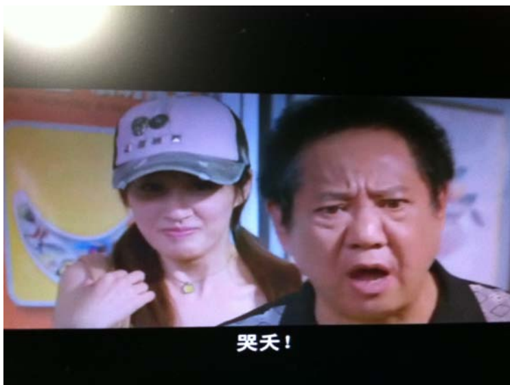
圖四：哭天。

圖四的情境是一位警察受傷被送到醫院救治，代表會主席(前者)趕到醫院關心，但警察的傷口難以包紮，導致包紮結果不甚理想甚至有幾分滑稽。代表會主席一看傻眼，直問到：「靠天，(紗布)怎麼包成這樣？」。雖然代表會主席罵了一句「靠天」，但這句髒話並沒有指向任何人，而是一種脫口而出的語氣。澳洲學者 Wajnyrb 指出，具有洗滌作用的咒罵不需指向任何人，它可以抒解突然暴漲的情緒，導正心情、恢復平衡。Wajnyrb 將這種咒罵視為「踢到腳趾的咒罵」，這種咒罵扮演著淨化、安撫、清除的角色，因為並不指攝任何人，縱使冒犯，也是一種我們都能體會的失禮行為 (Wajnyrb, 2006)。