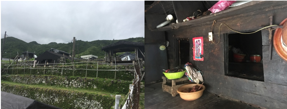
（圖為野銀傳統地下屋）

在蘭嶼的最後一天，我到野銀的傳統地下屋參觀，導覽先生是當地的老先生，他分享了很多達悟族的故事，他說隨著蘭嶼開放，以及房屋的現代化，傳統的地下屋已經沒有剩下幾間了，很多古老的工藝與生活習慣漸漸失傳了，大家都想要開民宿賺錢，生存方式經過劇烈的轉變。有一位受訪學生也表示，他們家準備要在蘭嶼開一家炸雞店，要先在台灣工作存錢，畢竟台灣有更多的工作機會，有了足夠的資本與技術之後，再回來開店。也因此有很多達悟父母親必須到台灣工作，但幾乎是從事較底層的勞力工作，無法在家陪伴孩子，造成當地家庭結構不穩定，家庭功能無法發揮。這也是受訪老師跟我說的，他們學校之所以安排學生住校，就是因為當地家庭功能不那麼彰顯，學校才會希望透過住校與晚自習，讓孩子有可以專心讀書的環境。