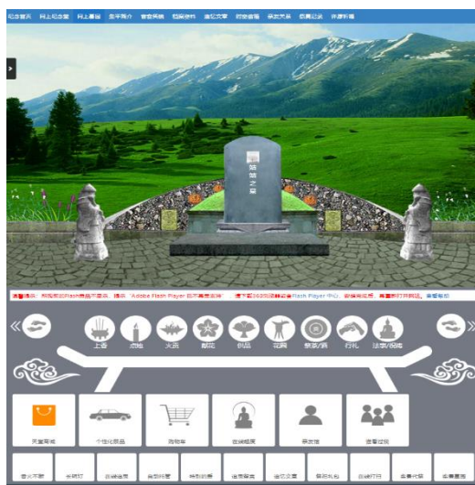
圖三、網路墓園截圖

若是想要再更加有實感，可以付費更換墓園的樣式，以真實的墓園照片替代網站自帶的虛擬墓園，更顯真實，也在視覺上和實體的墓園連結起來。